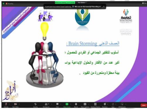
صورة لورشة العمل للمدربة