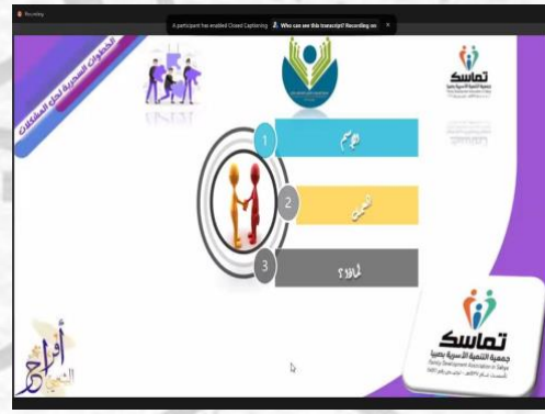
صورة لعرض التعرف بين المدربة والمشاركات