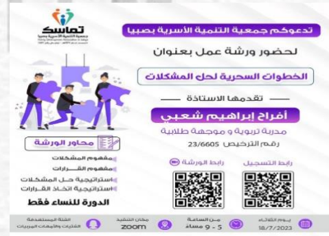
صورة لا اعلان البرنامج