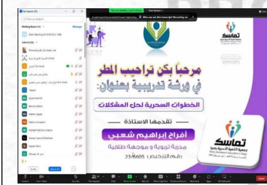
عرض مقدمة ورشة العمل مع عدد الحاضرات