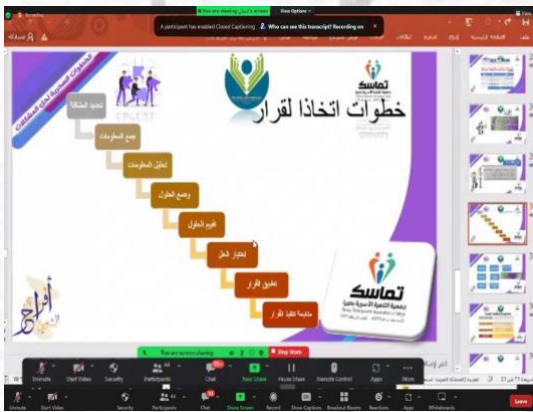
صورة من ورشة العمل لخطوات اتخاذ القرارات