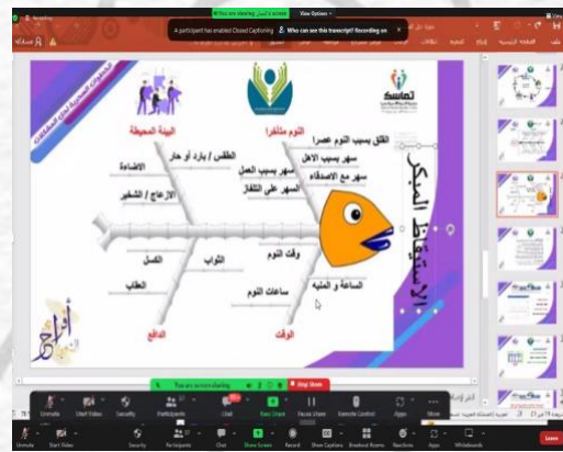
عرض للخطوات السحرية لحل المشكلات